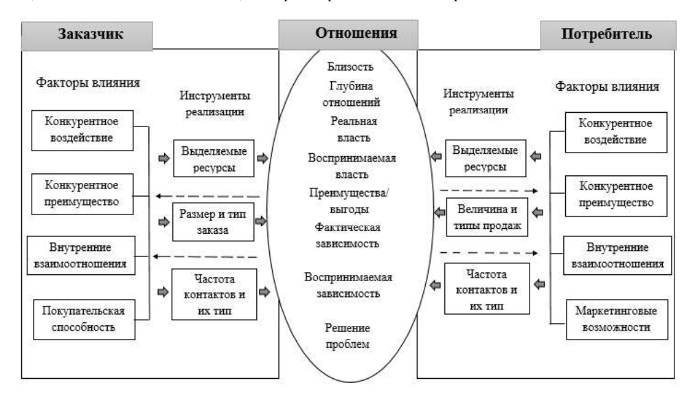
Рис. 2 – Модель оценки отношений между партнерами [20]

ли RAP процесса оценки взаимоотношений, которая может быть использована для идентификации и типизации характерных отношений, возникающих при совместной деятельности сухих и морских портов. Эти отношения исследуются с точки зрения управления транспортными системами и цепями. В контексте взаимодействия «поставщик-покупатель» (потребитель) классическая модель предполагает набор таких характерных отношений как: близость, глубина отношений, реальная власть, преимущество, фактическая и воспринимаемая зависимость, возможность решения проблемных вопросов. Согласно модели эти характеристики определяются двумя группами факторов, одна из которых относится к поставщику, а другая к покупателю (потребителю) услуг. В этих группах факторов в модели имеет место набор влияющих на эти группы отношений, характеристики которых связаны друг с другом конкурентной средой, транспортно-логистическими возможностями, планируемым объемом перевозок, частотой взаимодействия, которые представлены на рис. 2.