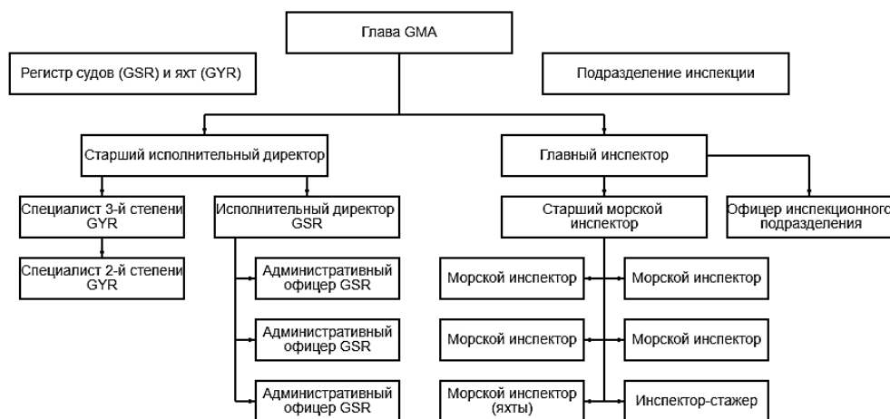
Рис. 3. Организационная структура GMA [14]

Морскую администрацию Гибралтара возглавляет морской администратор, который подчиняется министру, отвечающему за судоходство, подробная схема отражена на рис. 3.