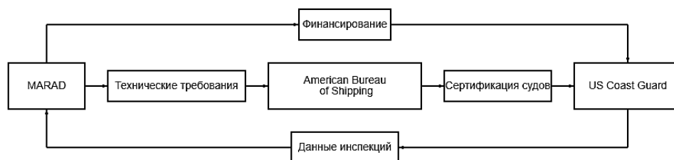
Рис. 5. Упрощенная схема взаимодействия агентств в США [17]

MARAD – это «экономический центр» морской политики США, тогда как USCG – ее «силовая» составляющая. ABS выступает техническим партнером обоих ведомств. Такое разделение позволяет эффективно сочетать коммерческие интересы и безопасность (рис. 5).