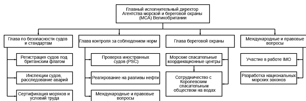
Рис. 1. Внутренняя структура МСА [12]

МСА подчиняется Министерству транспорта Великобритании (Department for Transport, DfT) и имеет следующую структуру (рис. 1):